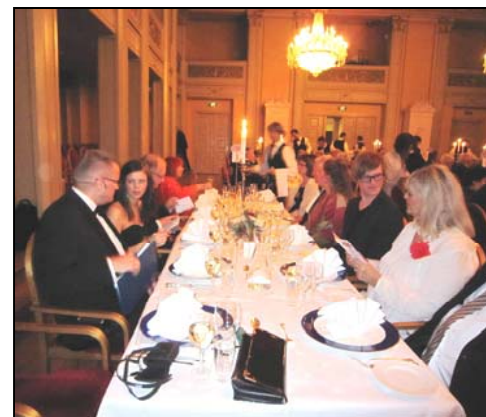
Jubileumsfeiring i Gamle Logen.