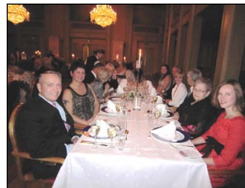
Fra bordet, glade gjester.