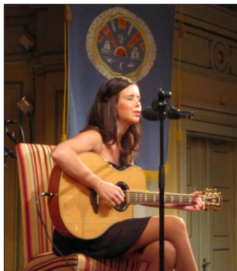
Thea Brinchmann Styve