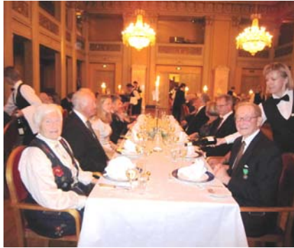
Glade jubileumsgjester.

den store salen med scene for underholdning. Det store spørsmålet var – hvem får jeg til bords? Jeg var heldig jeg - med Jakob ved min venstre side - og nesten bare kjente fjes rundt meg. Stilfullt dekkede bord med fargerike blomsterdekorasjoner - og fine bordkort med nyttig informasjon. Ti bord ialt – fordelt i den store salen.