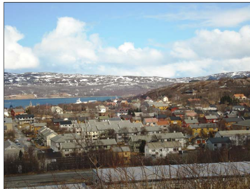
Kirkenes 2. Mai 2011.