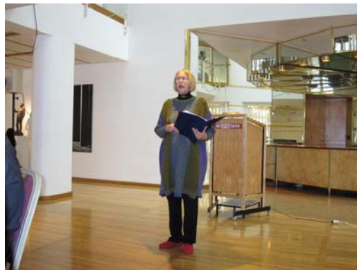
Henny Moan leser tekster av Elias Blix ved kaffen på Det Norske Teatret