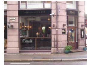
Mauds. Et norsk spisested

Hjørnet Tollbugt/Nedre Slottsgt Tollbugata. 24