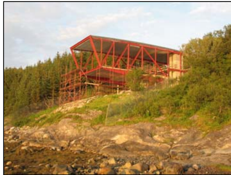
Husk Det nye Petter Dass-museet og reisen til åpningen. Se NT nr 41 juni 2006