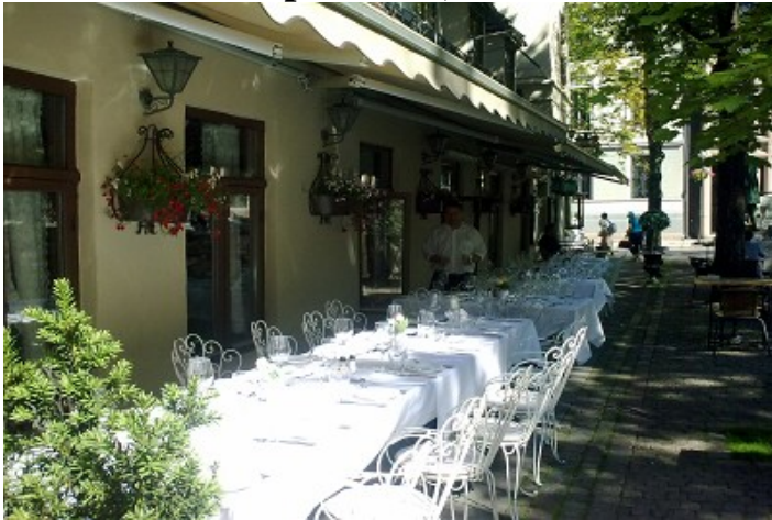
Engebret, Oslos eldste restaurant