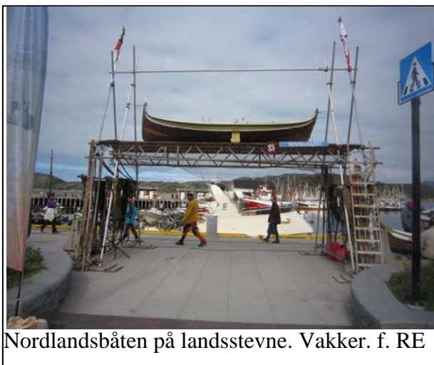
Nordlandsbåten på landsstevne. Vakker. f. RE

Underholdning med sirkusmusikalen Havet, foredrag, seilregatta med tradisjonsbåter, roregatta, leker for barn, øvelse i lassokasting, lage leker av skjell og mye, mye mer.