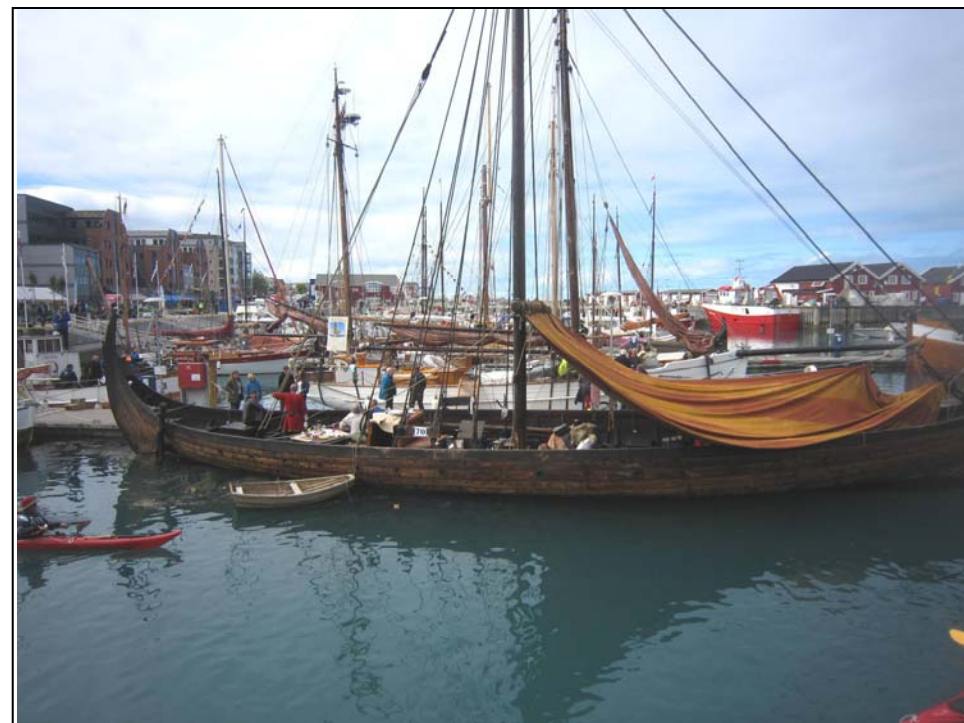
Foreningen KYSTENS landsstevne i Bodø 14.- 17. juli 2016.