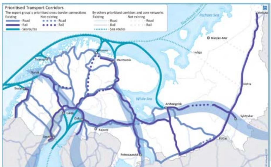
Figure 1: BEATA's Expert Group's prioritized transport network

"Barentsregionen er fylt med spennende muligheter. Den økte oppmerksomheten til regionen er en positiv kraft i å bringe oss sammen for å finne gode løsninger og å realisere potensialet for videre vekst og utvikling, og å samarbeide om gode og bærekraftige løsninger som på strategisk nivå er skåret ut for transportsystemet i regionen.