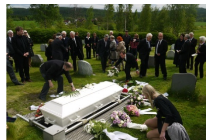
Lørenskog kirke. 27.5.2014