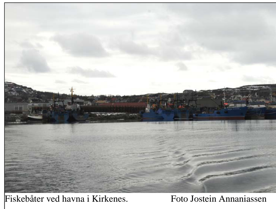
Fiskebåter ved havna i Kirkenes.