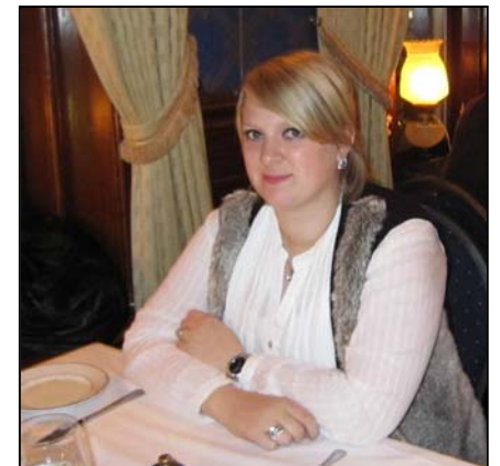
Camilla Myrli Foto RE