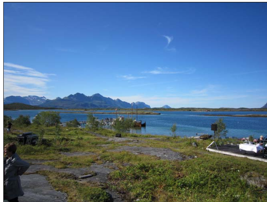
Gildeskål kirkested 14.8.2011.