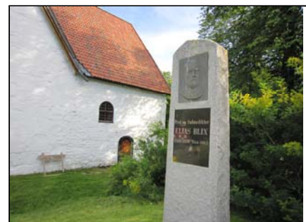
Gildeskål gamle kirke. Bauta av Elias Blix.

Så tilbake til Gildeskål hovedkirke til konserten "Små øyeblikk – Salmar frå eit samliv." En ting er at kirka ligger så vakkert til og er så vakker innvendig, at den var helt full av forventningsfulle mennesker, en annen ting er at jeg var sikker på en flott opplevelse, men at det skulle bli en så utrolig annerledes tolkning av Elias Blix og en så spennende, levende, engasjerende forestilling hadde jeg ikke kunnet forutse. Musikken, komponert av Knut Reiersrud og Trym Bjønnes, tok helt pusten fra en. Den hadde "element av folketonar, blues og country" forteller Ragnar Hovland, han som hadde skrevet stykket.