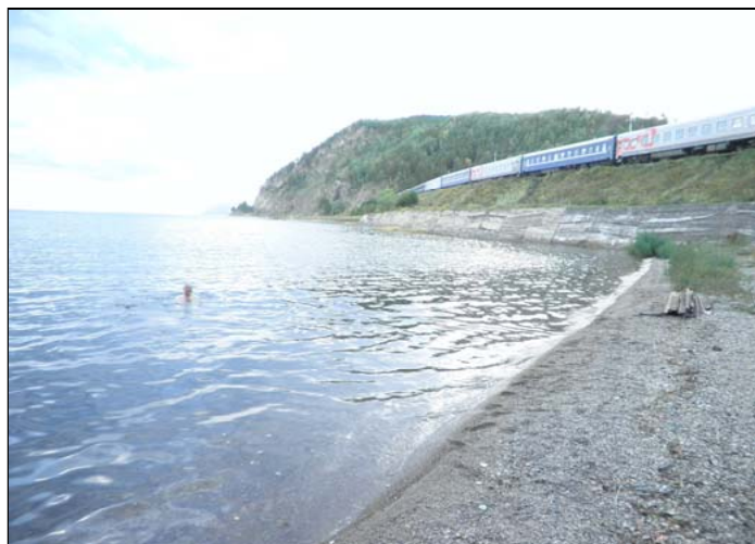
Bajkalsjøen med "Tsaren Gold"