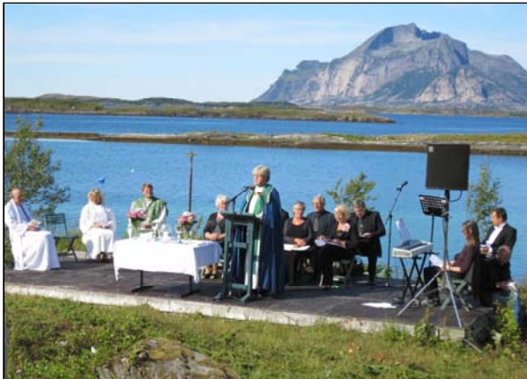
Utegudstjenesten på bergan