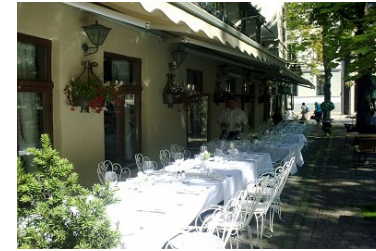
Engebret, Oslos eldste restaurant

Velkommen til Boknafiskaften på Engebret