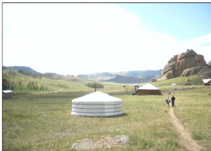
"Jurt" Mongolsk landsbygd .

Torsdag 20.10.2011 i BBF Bennechesgt. 2 kl 18:30 Elias Blix 175 år 1836-1902 Små øyeblik -SALMAR FRÅ EIT SAMLIV-