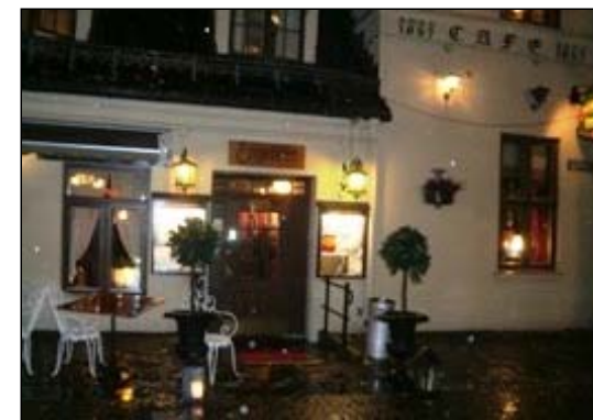
Engebret, Boknafiskafteften 14.11.09