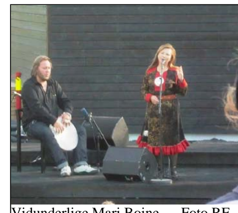
Vidunderlige Mari Boine