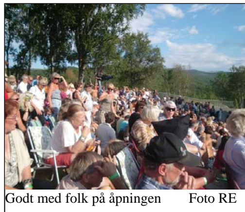
Godt med folk på åpningen