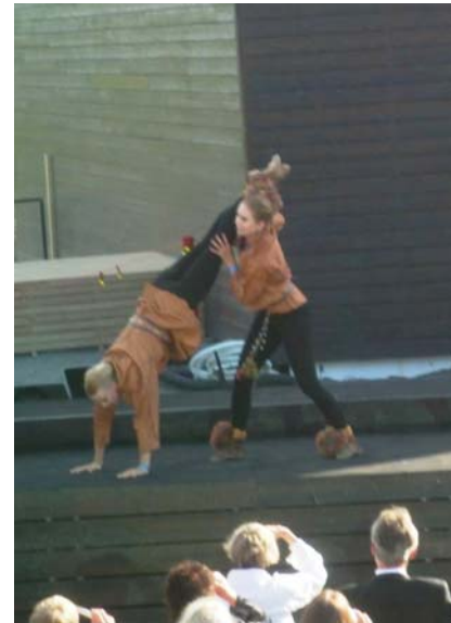
Spreke dansere fra Sørsamisk teater.