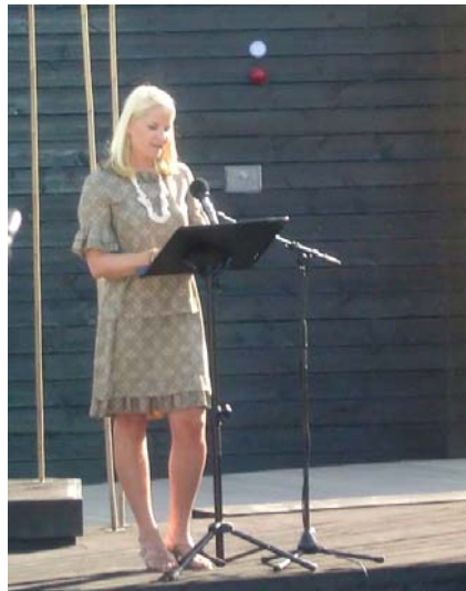
Kronprinsesse Mette-Marit

Vi var heldigvis så tidlig ute at vi kunne sette oss helt på kanten i skråningen foran scenen. God utsikt til de søte små som ventet på Kronprinsesse Mette-Marit med fine blomsterbuketter. Og hun kom, i en nydelig kjole, med sitt lyse vakre hår bølgende rundt det glade ansiktet.