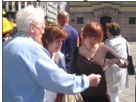
Birger verver nye sangere til NFK