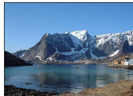
Reine i Lofoten

Jeg så 5 fiskeørner som satt på holmer vi passerte og vi matet måker som tok maten i lufta.