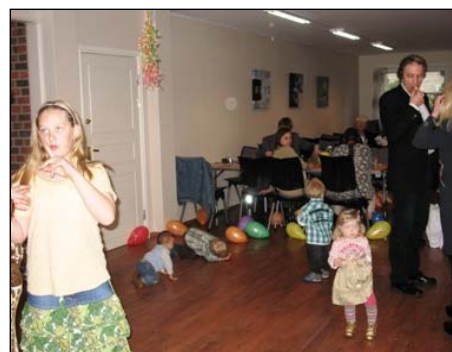
Festen er i gang.