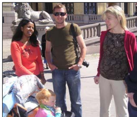
Hun t.v skal til Finnmark som Turnuslege. Flotte ungdommer