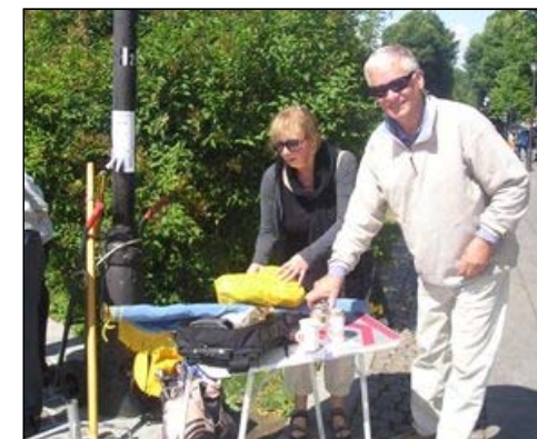
Bord og materiell må ordnes til vervekampanjen