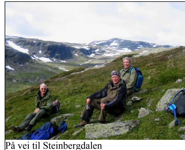
På vei til Steinbergdalen

I 1998 hadde vi en fin tur i Jotunheimen. Vi tok bussen opp til Bygdin hvor vi gikk om bord i båten "Bitihorn" som tok oss til Eidsbugarden hvor vi overnattet. Så gikk turen til Gjendebu før vi neste dag gikk opp det bratte Bukkelægret som har stigning opp til toppen på nærmere 500 meter. I øverste