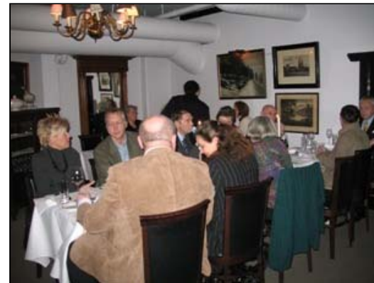
Boknafiskaften på Mauds 24.11.07