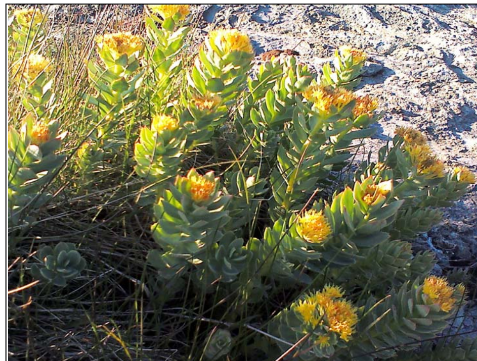
Rosenrot ( Sedun roseum) på bergene ved Breiosen i Nordland, 25.06.2015