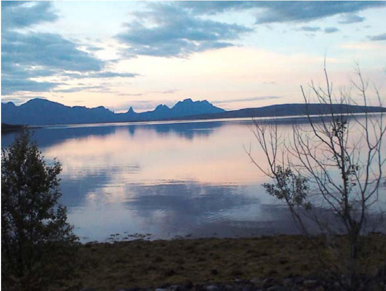
Forsan , ved utløp tunellen Steigensida, utsikt Hamarøyskaftet