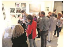
TRENGSEL: Boksigneringen skapte litt ka, og mange interesserte sikret seg sitt eksemplar og også bøker som gaver, med hjelp fra forfatteren.