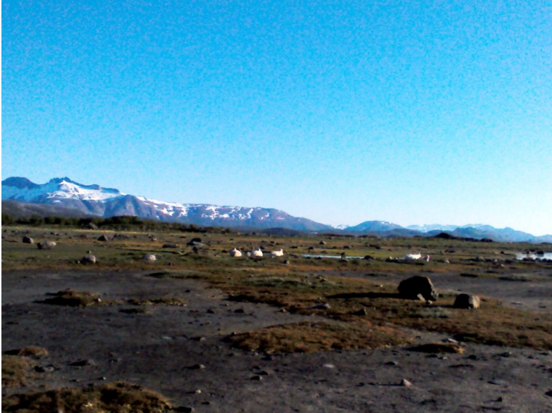
Breiosen i Nordland, hvite saueulldotter mot Børvasstindan og en blå, blå himmel, 21.06.2015