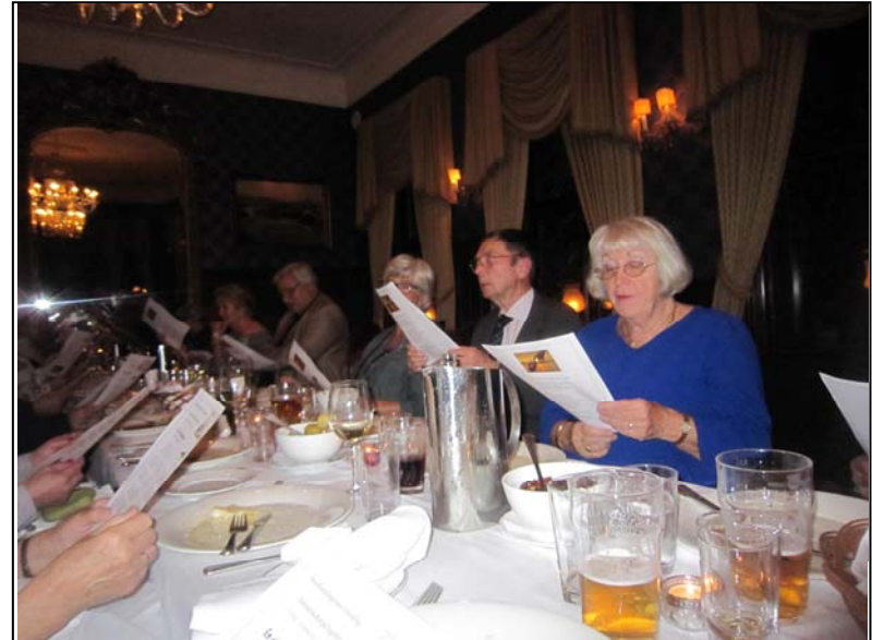
Boknafiskaften på Engebret 7. nov 2015. En glad allsang.