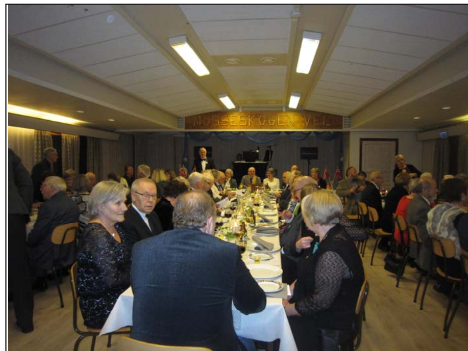
Nordlændingenes forening i Moss, 70 års feiring 4. mars 2017.. f. R. E