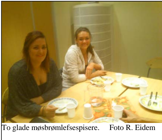
To glade møsbrømlfseespisere.

Første mandagen i hver vintermåned samles vi som er hekta på møsbrømlfse i Saltværingen . Den holder til i Kurbadet, Akersgt. 74, Oslo, inngang Thor Olsensgt. Ring til Solveig, hvis dere lurere på noe. Jeg sier bare: Velkommen til en gastronomisk nytelse: Nam, nam!